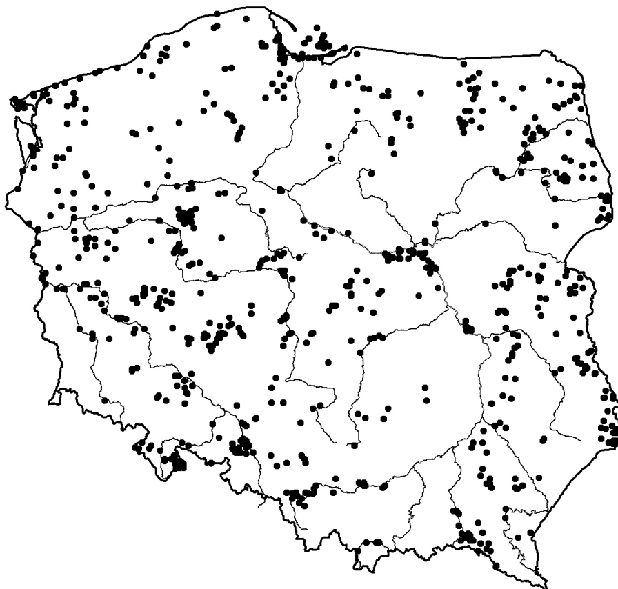
Ryc. 1. Miejsca obrączkowania ptaków w Polsce w roku 2006.