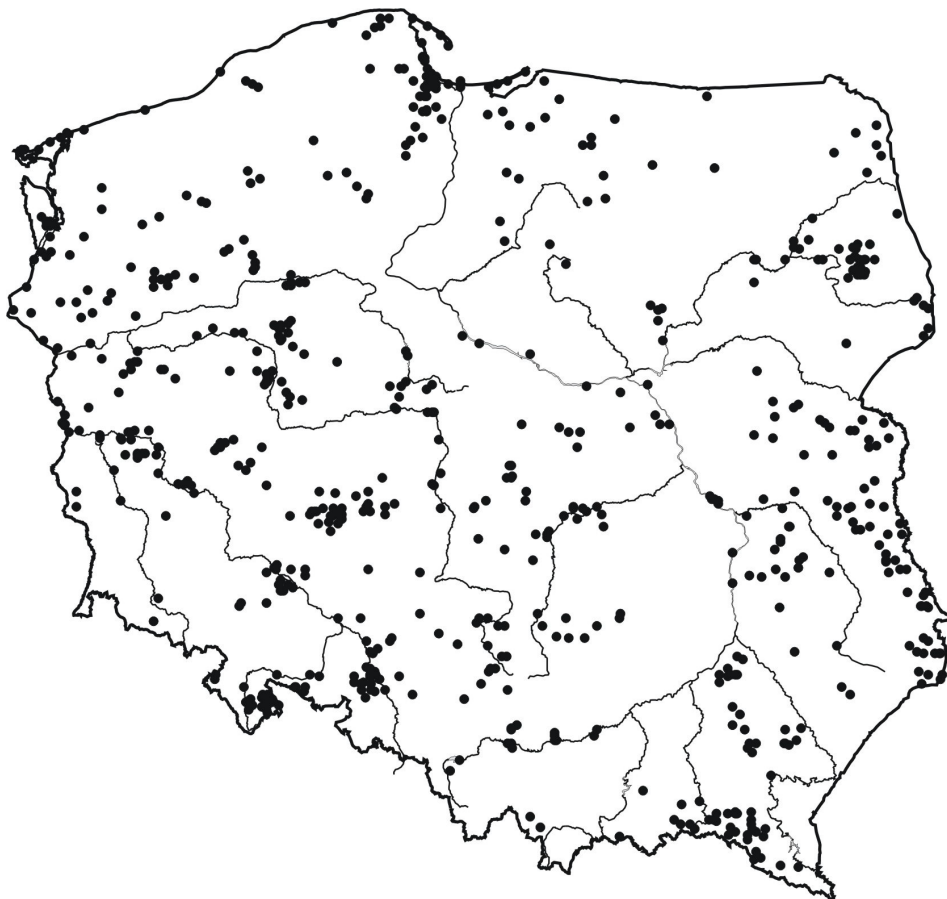
Ryc. 1. Miejsca obrączkowania ptaków w Polsce w roku 2005.